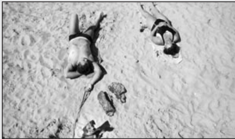
■ De opwarming van de aarde doet de golfstroom, die ervoor zorgt dat het Europese klimaat zacht blijft, stilvallen. Over enkele decennia is het dus gedaan met zonnekloppen aan de Belgische kust.