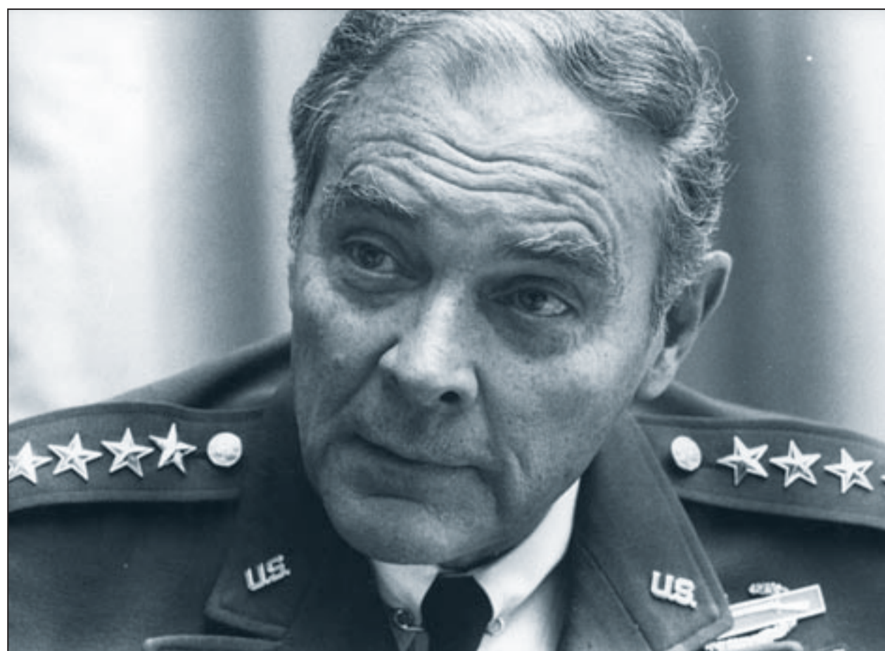
■ In 1979 werd een aanslag gepleegd op Alexander Haig, Amerikaans generaal en toenmalig Navo-opperbevelhebber. De mislukte aanslag werd opgeëist door de Brigade Julien Lahaut, een groepering waar niemand ooit van had gehoord.

Meer dan veertig jaar lang hebben de stay behind -netwerken, die opgericht werden op initiatief van de CIA en gecoördineerd werden vanuit een commandocentrum bij de Navo, in het diepste geheim kunnen opereren in