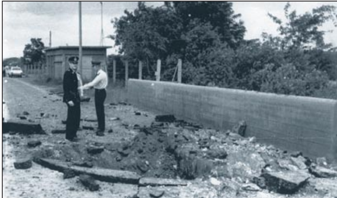
■ 25 juni 1979, in de buurt van Bergen: Alexander Haig overleeft een terreuraanslag met een 20 kilogram zware plastic bom, die 40 centimeter onder het wegdek was aangebracht.