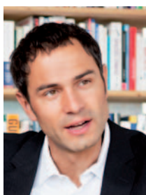
Dr. Daniele Ganser

Maler und Gipser spielen eine wichtige Rolle beim Einsparen von Energie in der Schweiz. Denn es sind die Maler und Gipser, welche die Hausbesitzer beraten und für einen perfekten Zustand der Gebäudehülle zuständig sind. Gewisse Politiker bezeichnen eine Pinselsanierungen als grobfahrlässige Fehlberatung.